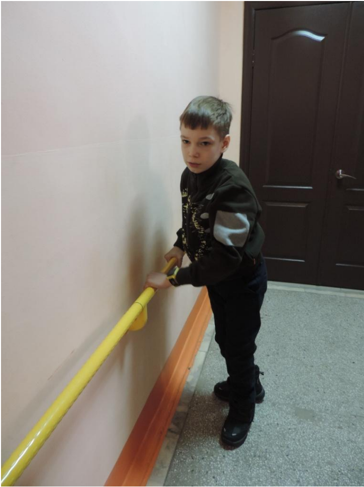
Фото 4 Зона целевого назначения